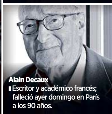
Alain Decaux Escritor y académico francés; falleció ayer domingo en París a los 90 años.