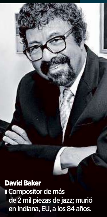
David Baker Compositor de más de 2 mil piezas de jazz; murió en Indiana, EU, a los 84 años.

El mundo de la cultura despidió ayer a tres creadores: