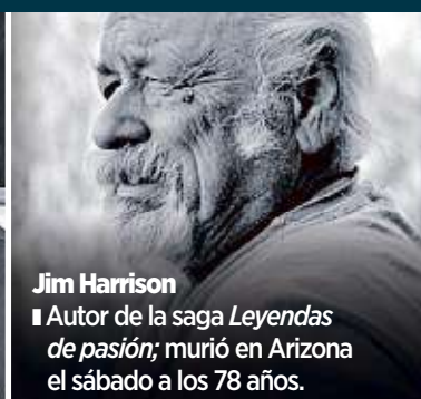
Jim Harrison Autor de la saga Leyendas de pasión ; murió en Arizona el sábado a los 78 años.